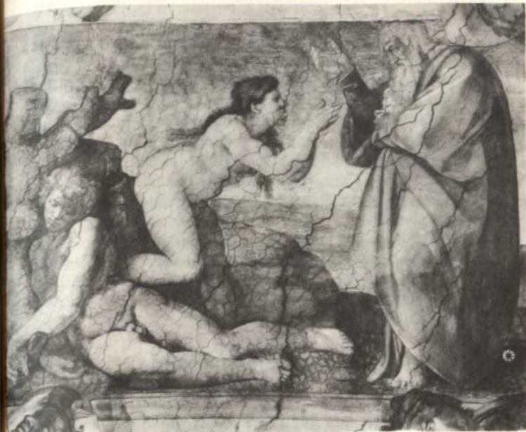
Creación de Eva. Fresco de Miguel Ángel en el techo de la Capilla Sixtina Foto Anderson.

Hay que considerar, en primer término, que primero es seducida la mujer y ésta seduce luego al varón. En un capítulo posterior he de exponer en qué sentido es la mujer el sexo